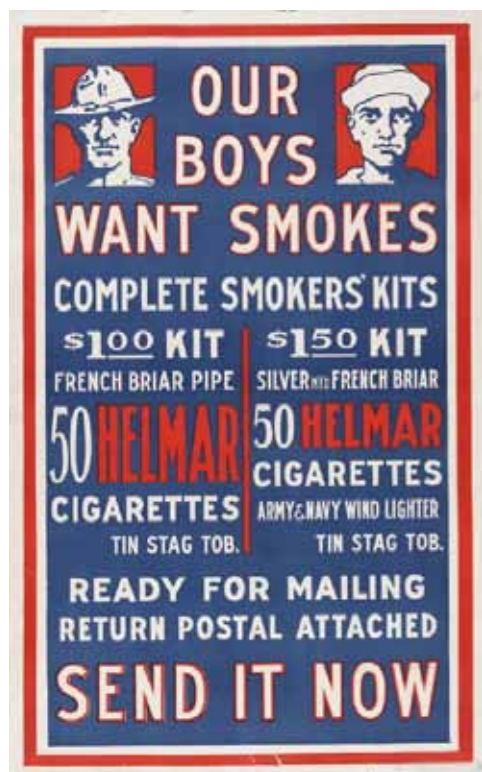
Gráfico 2: Aviso de Tabaco en Épocas de Guerra